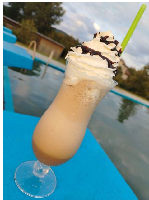
text i foto Pavla Dubová Malá