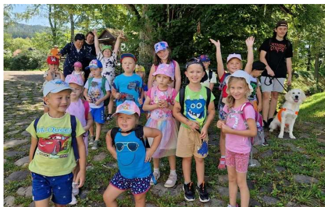
Tak pac! Vaše Marci a holky z naší školky

Už teď je jasné, že školku Kameňáček toho v novém školním roce čeká opravdu hodně. Přeji dětem, ať dělají malé krůčky i velké skoky vpřed. Žádný z nich přitom není důležitější, hlavně ať se mají při zavravorání o koho opřít. Přeji Vám všem krásný školní rok s úsměvem na tváři. I já se budu pomalu se školkou loučit a jsem si jistá, že se už navždy otočím za každým dětským smíchem. Děkuji vám děti, rodiče, i všem holkám ze školky za krásný rok ve školce, kde jsem mohla růst od štěněte k hrdinovi.